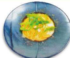
Scallops & Wild Rocket Spicy Roe Cream Sauce 帆立とセルパチコの 明太クリームソース