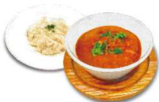
Today's Curry and Rice 本日のカレーライス 創業当時の人気メニュー