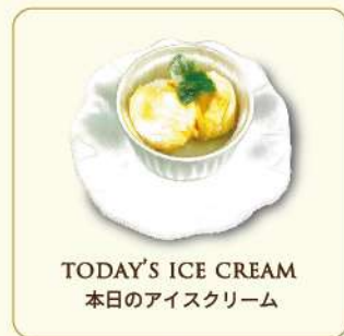
TODAY'S ICE CREAM 本日のアイスクリーム