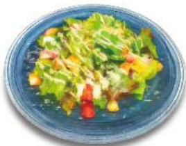
Today's Salad 本日のサラダ ボリューム満点 シェフオリジナルサラダの