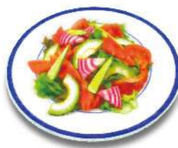
Salmon & Avocado Salad チリ産サーモンとアボカドのサラダ アボカドの食感がアクセントの 自家製サーモンマリネのサラダ