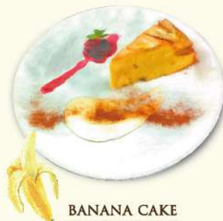
BANANA CAKE バナナケーキ