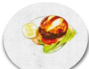
B.B. Burger B.B. バーガー 肉の旨味をダイレクトに感じる BAGUS BARの新定番!