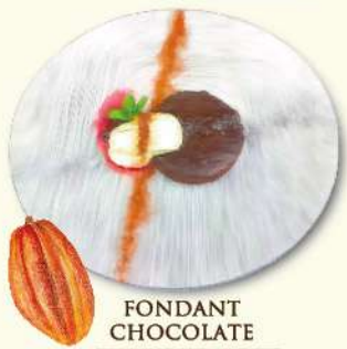
FONDANT CHOCOLATE フォンダンショコラ