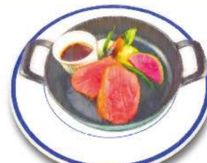
Harbor Side Beef Steak ハーバーサイド・ステーキ 運河を眺めながら食べる 和風オニオンソースのビーフステーキ