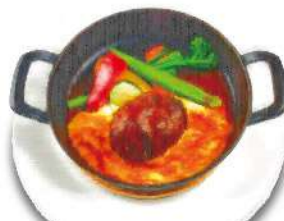
Bagus Hamburg Steak バグース・バーグランチ つなぎ一切不使用のビーフ100% ハンバーグを自家製デミグラスソースで