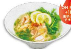
Chicken Pho 国産鶏もも肉のフォー・ガー 丁寧に汁をとった 優しいスープで食べる米麺の汁そば