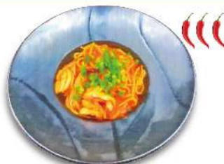
Picante Arrabbiata with Shrimp 激辛! 赤エビの ピカンテ・アラビアータ