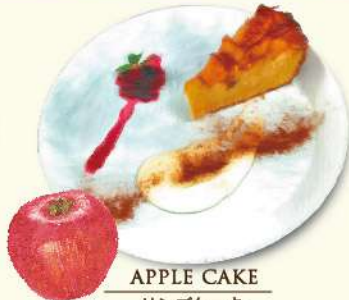
APPLE CAKE リンゴケーキ