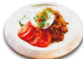
Thai Gapao Rice バグース特製 ガバオライス 甘辛い特製タレに黄身をくずして