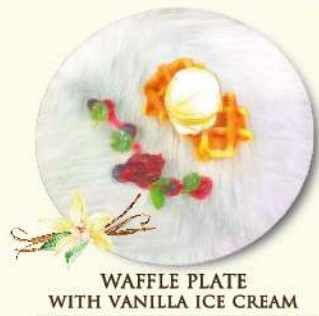
WAFFLE PLATE WITH VANILLA ICE CREAM ベルギーワッフル パニラアイス添え