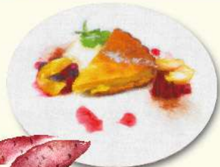
SWEET POTATO TART さつまいものタルト