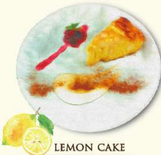
LEMON CAKE レモンケーキ