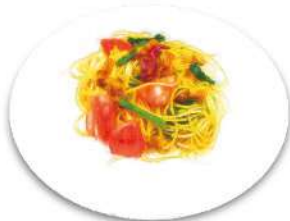
Bacon, Fresh Tomato & Spinach Peperoncino 厚切りベーコンとフレッシュトマト・ ほうれん草のペペロンチーノ