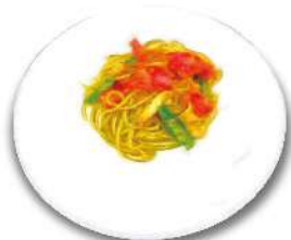
Today's Pasta 本日のパスタ 旬の食材をふんだんに 使用した特製パスタランチ