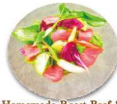
Homemade Roast Beef & Seasonal Vegetables Salad 自家製ローストビーフと彩り野菜のサラダ 特選ランプ肉のローストビーフと バルサミコドレッシング