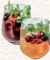
Homemade Sangria 自家製サングリア フレッシュフルーツとワインの風味を生かした オリジナルサングリア 900